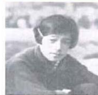
（人見絹枝「ゴールに入る」より転載）