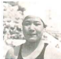
（橋山歴史文化博物館資料より転載）