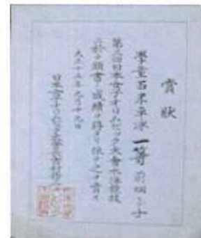
(賞状:橋本市郷土資料館所蔵)